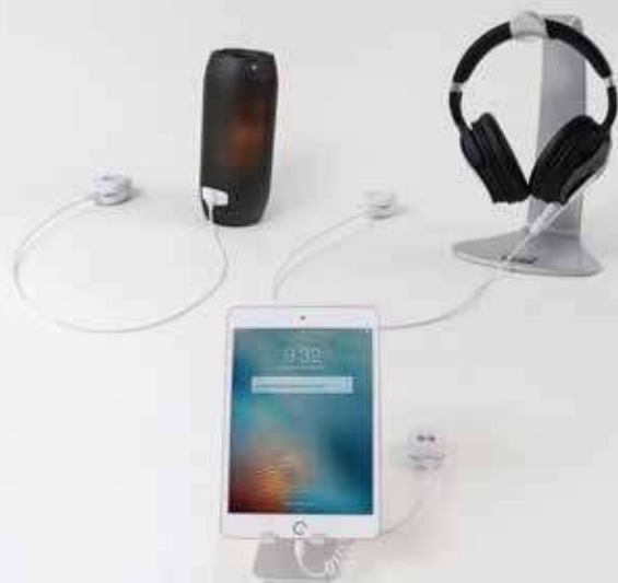
Comercialización flexible y rápida.

Comercialización flexible. Asegure otros productos y accesorios con la variedad de cables sensores.